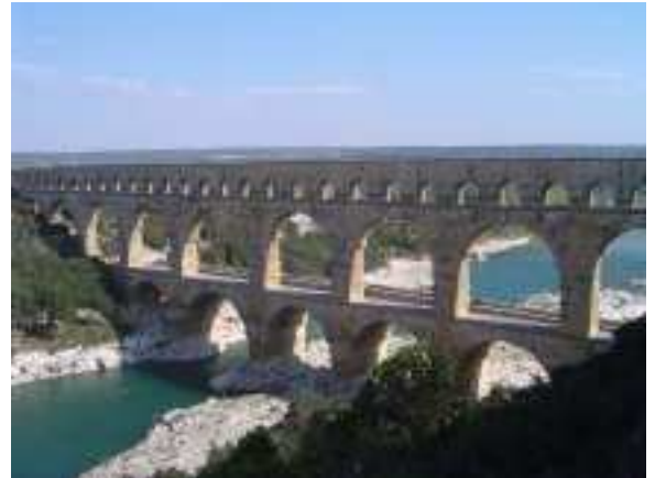
Le pont du Gard

Aller à la fontaine est une corvée quotidienne pour les ménages les plus modestes. Les autres, moyennant finance, peuvent se faire livrer à domicile par les porteurs d'eau. Cette profession existera jusqu'au XIXe s. !!!